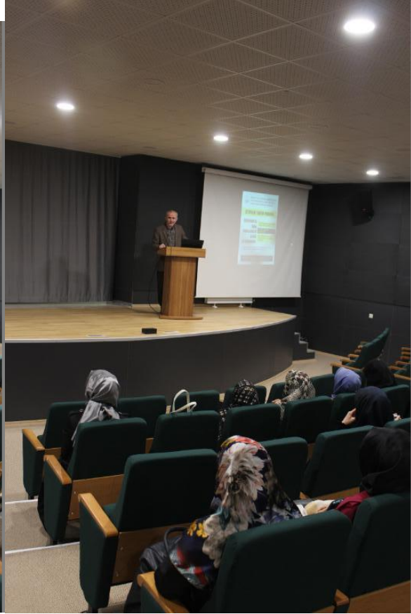
6-) 18 NİSAN İLAHİYAT FAKÜLTESİ KONFERANSI DÜZENLENDİ.